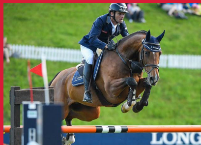
DAIMLER (mère par Lupicor), né chez G. KRUITTER (NED)